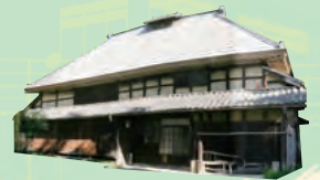
江戸後期に建てられた古民家